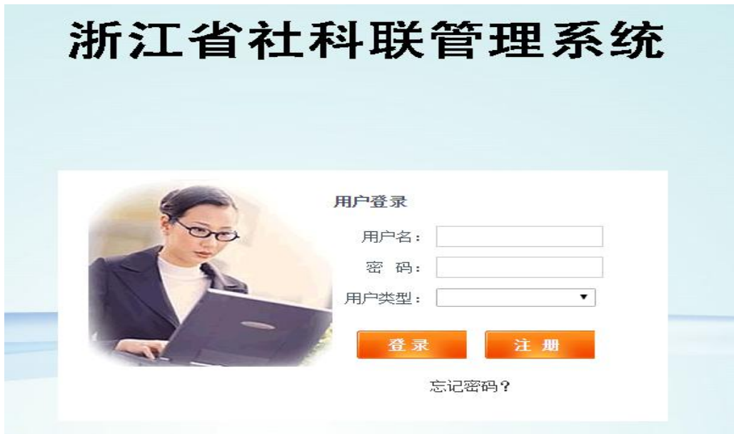
图 1-1 系统首页

用户通过浙江社科网功能区中的项目申报管理系统入口或通过浏览器直接打开网址 http://www.zjaskw.gov.cn/zjasklxmsb/ 即进入浙江省社科联管理系统登录界面，如图 1-1 所示，页面有“登录”和“注册”按钮两个按钮。