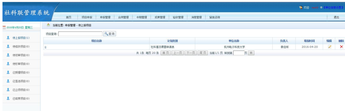
图 2.6-1 申报管理主界面