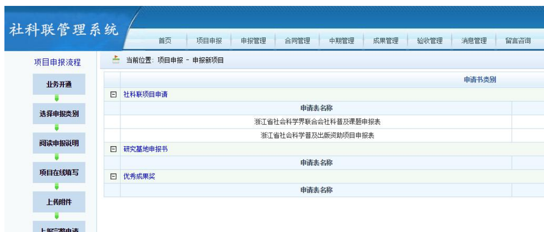
图 2.5-1 申报新项目界面