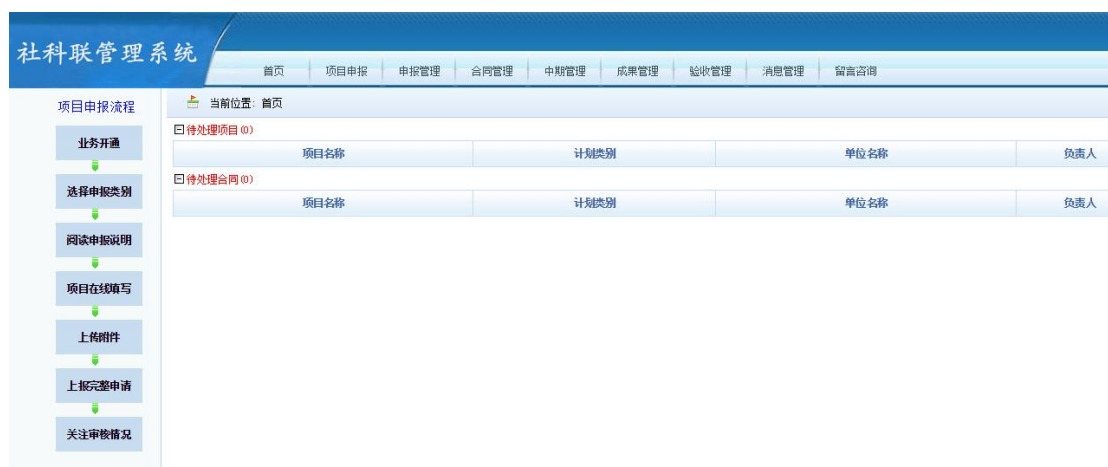
图 2.4-1 系统主页

“申报管理”、“合同管理”、“验收管理”、“消息管理”和“留言咨询”等等选项，点击进入相应的页面；页面左侧为树形的项目计划体系，点击进入新项目填报；页面右侧为有关消息、通知；页面中部为待办事项的列表。