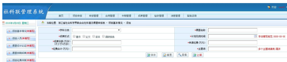
图 2.5-3 申请书填写界面（该页面截取部分图片）

仔细阅读“项目概述”、“填写说明”、“其他注意事项”后，点击“开始申报”进入申请表填写界面，如图 2.5-3 所示。整个申请表一般由几个模块共同组成，以“浙江省社会科学界联合会社科普及课题申报表”为例，它包括“项目基本情况”、“项目人员”、“课题设计论证”、“课题预期成果”、“项目经费预算”、“附件”等几个页面。请注意填写格式，格式错误、日期先后不合理等都将不允许保存和上报申请表。