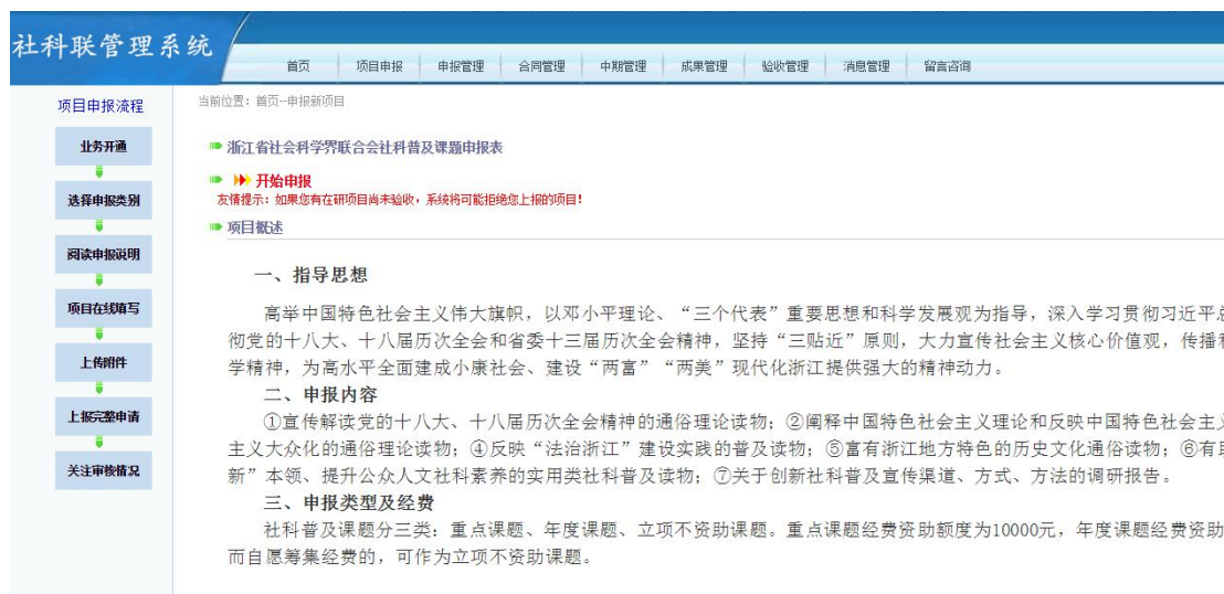
图 2.5-2 项目申报说明界面