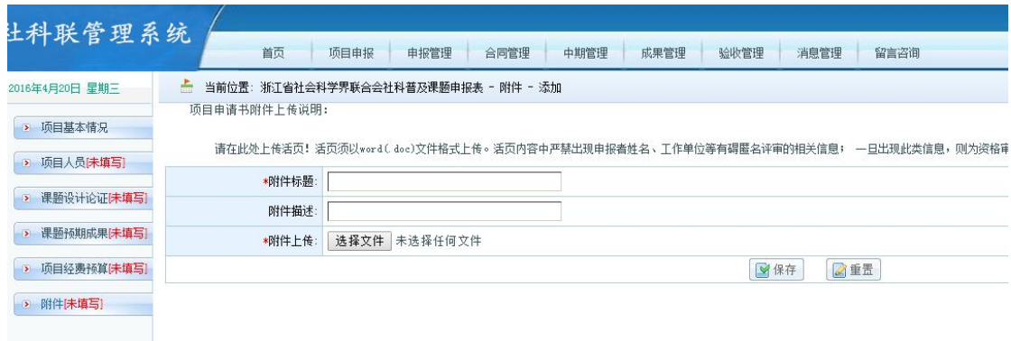
图 2.5-4 附件上传界面